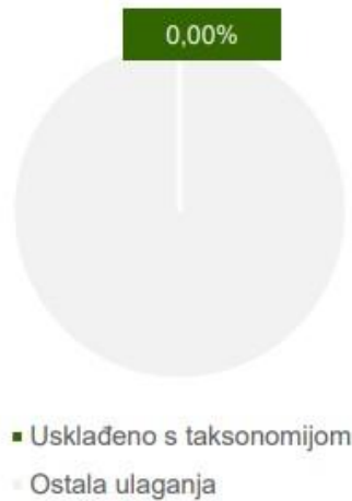
1. Usklađenost ulaganja s taksonomijom uključujući državne obveznice*